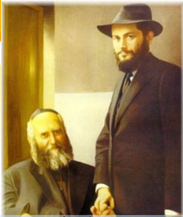
בתמונה: הרבי הריי"צ (יושב) וחתנו רבי מנחם מענדל שניאורסון, לימים הרבי, נשיא דורנו

לחיות עם הזמן... (אדמו"ר הזקן) - היינו שבכל זמן וזמן מתרחשת פתיחת שער רוחני, דרכו יורדים לעולם הזה אור ושפע מיוחדים, אשר יש להכין כלים כדי לקלוט 'גשמי ברכה' אלה ולתרגמם למעשים עד אשר תואר, באופן ממשי, סביבתנו המיידית בגוון המסוים של נתינת הכח הטמונה באותו זמן.